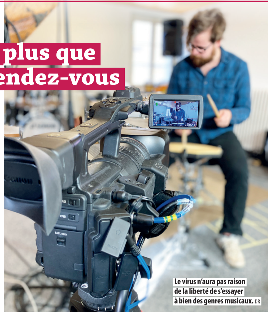
Le virus n'aura pas raison de la liberté de s'essayer à bien des genres musicaux.